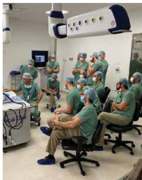
■ Curso teórico-prático de cirurgia robótica em urologia – Hospital Israelita Albert Einstein