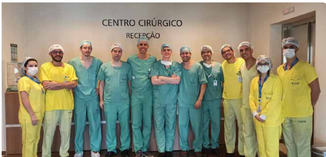
■ Tratamento do câncer de próstata e renal minimamente invasivo