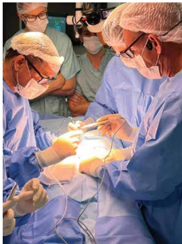
■ Inovações e Técnicas Avançadas em Implantes Penianos – HC-FMUSP