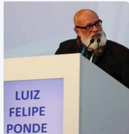
Palestras do jornalista William Waack e do filósofo Luiz Felipe Pondé