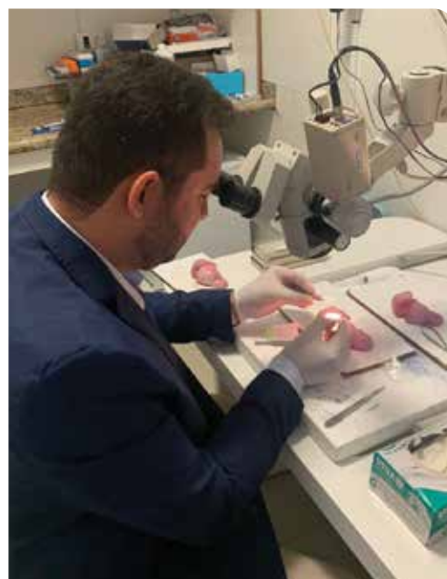
■ Métodos de recuperação cirúrgica de espermatozoides para ICSI – FMABC