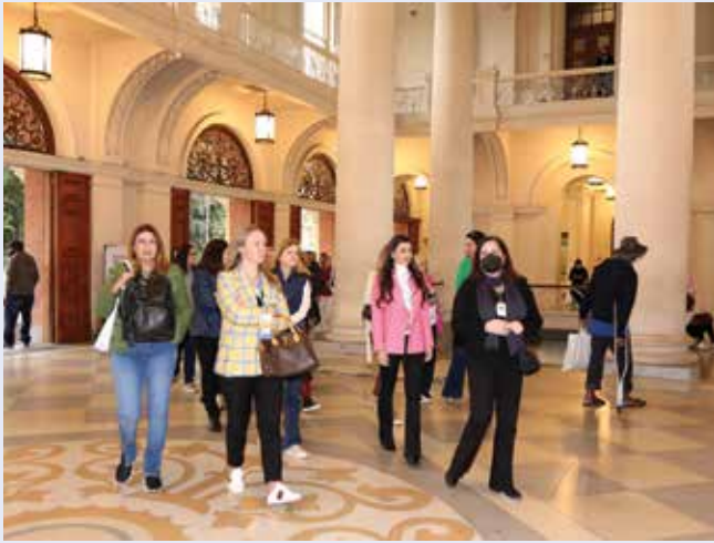
Interior da Pinacoteca