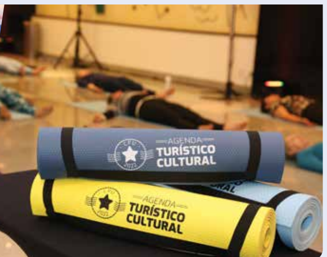
Prática de Yoga