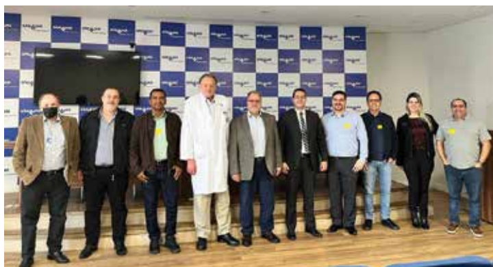
■ Litotripsia extracorpórea – Hospital São Luiz Jabaquara