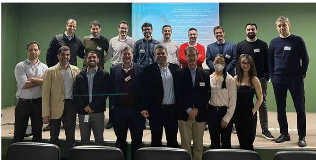
■ Curso prótese peniana – Hospital Brigadeiro