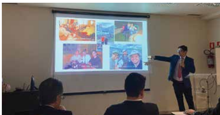
■ 1ª Jornada de cirurgia reconstrutiva uretral e protética do Hospital do Servidor Público Estadual de São Paulo – Hospital do Servidor Público Estadual de São Paulo