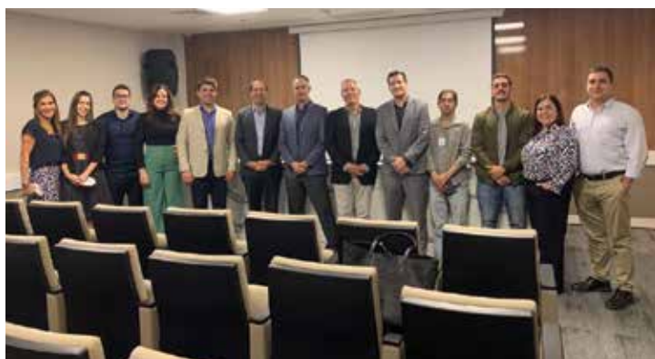
■ MISTs: um novo conceito no tratamento da HPB – Hospital Blanc