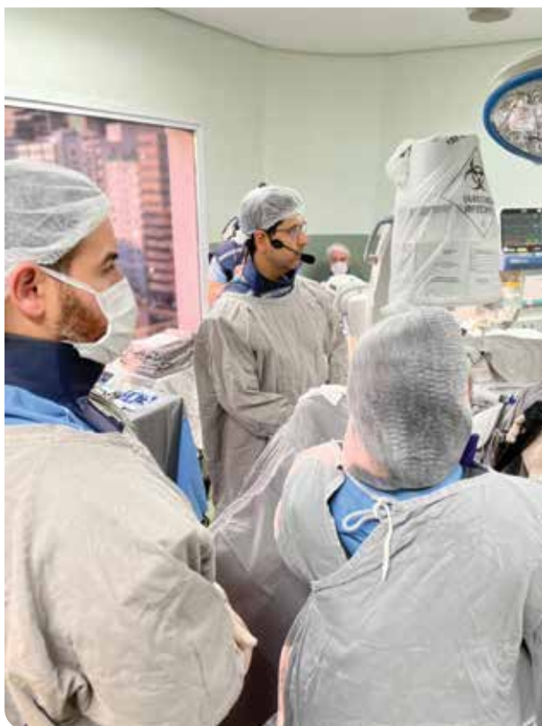
■ Mini-ECIRS com o novo Thulium Fiber Laser: o futuro chegou – Hospital Brigadeiro