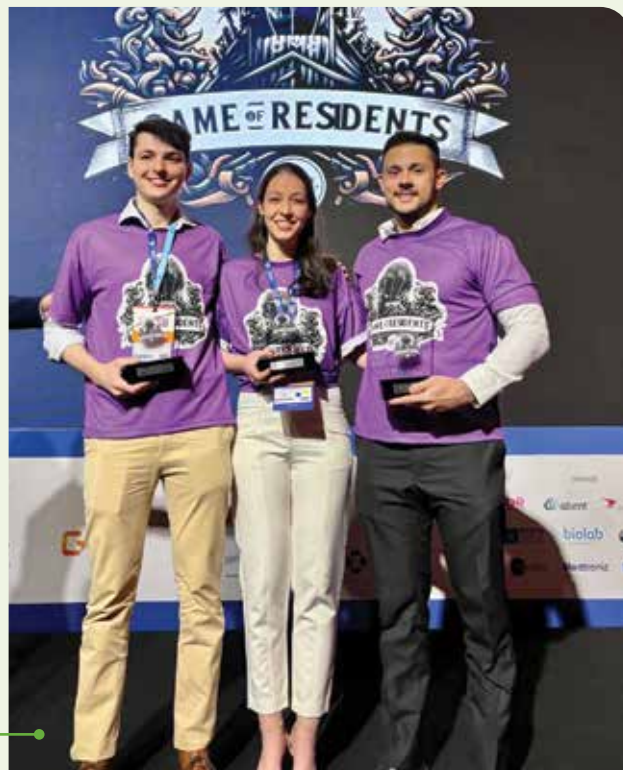
Equipe da Unicamp, ganhadora do II Game of Residents no CPU 2024

Foi uma excelente oportunidade de integração entre jovens residentes de diferentes partes de São Paulo, instigando o raciocínio e estimulando a participação ativa no congresso, além de ter sido um momento de descontração e união. O jogo teve duas etapas. Na primeira, uma parte prática com a realização de procedimentos