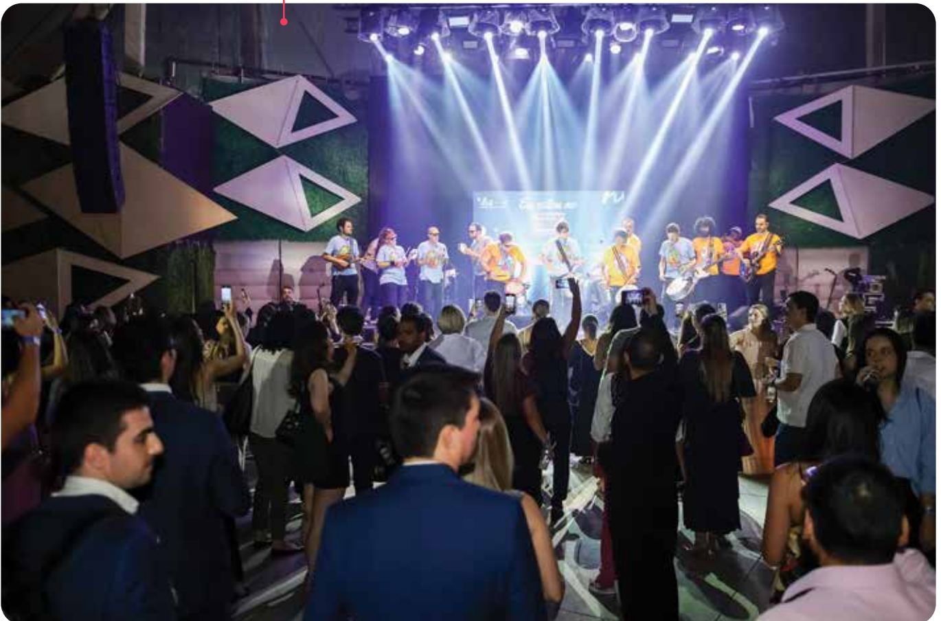
Festa de encerramento do CPU2024