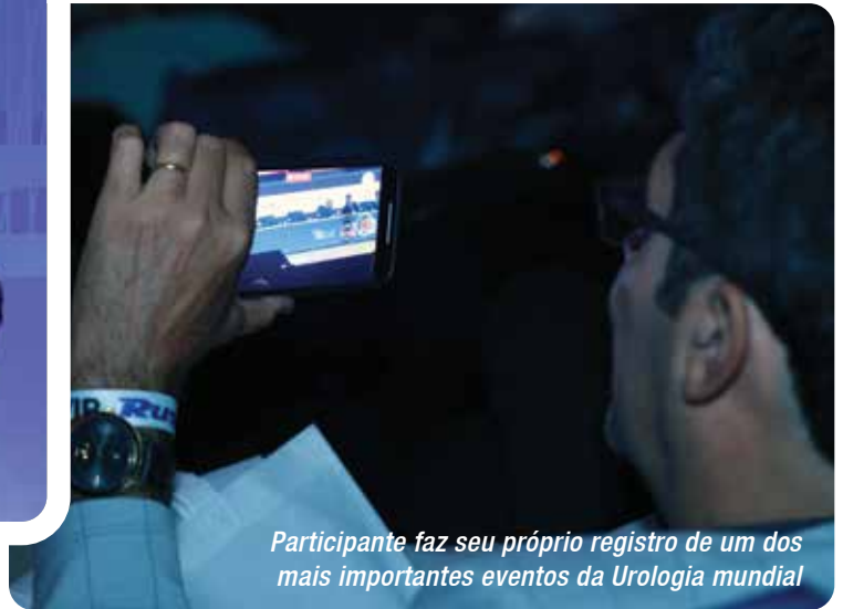
Participante faz seu próprio registro de um dos mais importantes eventos da Urologia mundial