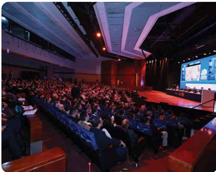
A plenária Teatro, sempre lotada, teve uma programação científica rica em vídeos sobre cirurgias de todas as subáreas da Urologia