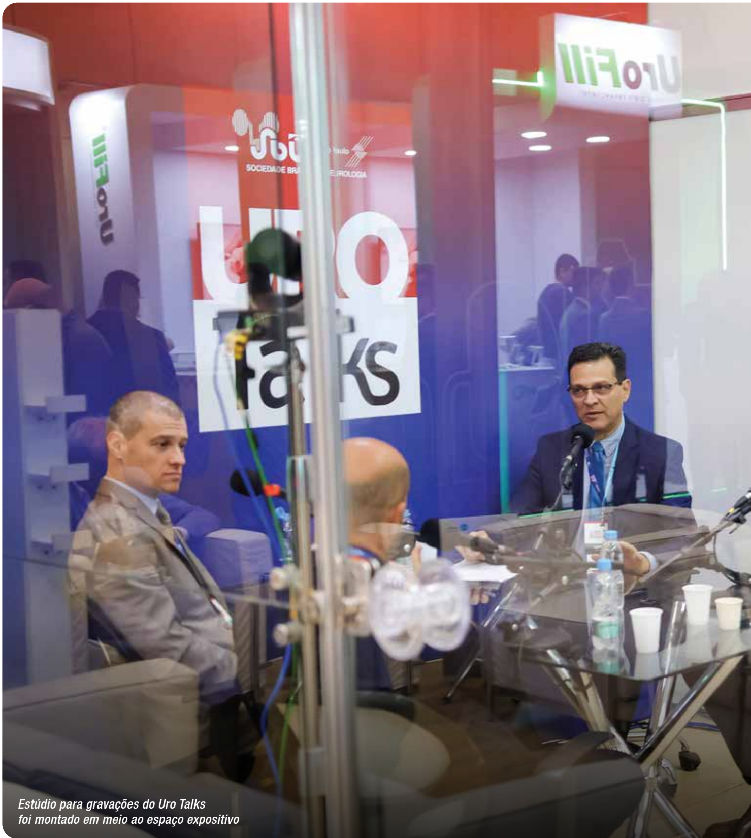
Estúdio para gravações do Uro Talks foi montado em meio ao espaço expositivo