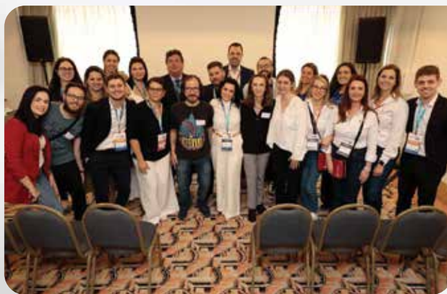
Participantes do encontro sobre bexiga neurogênica