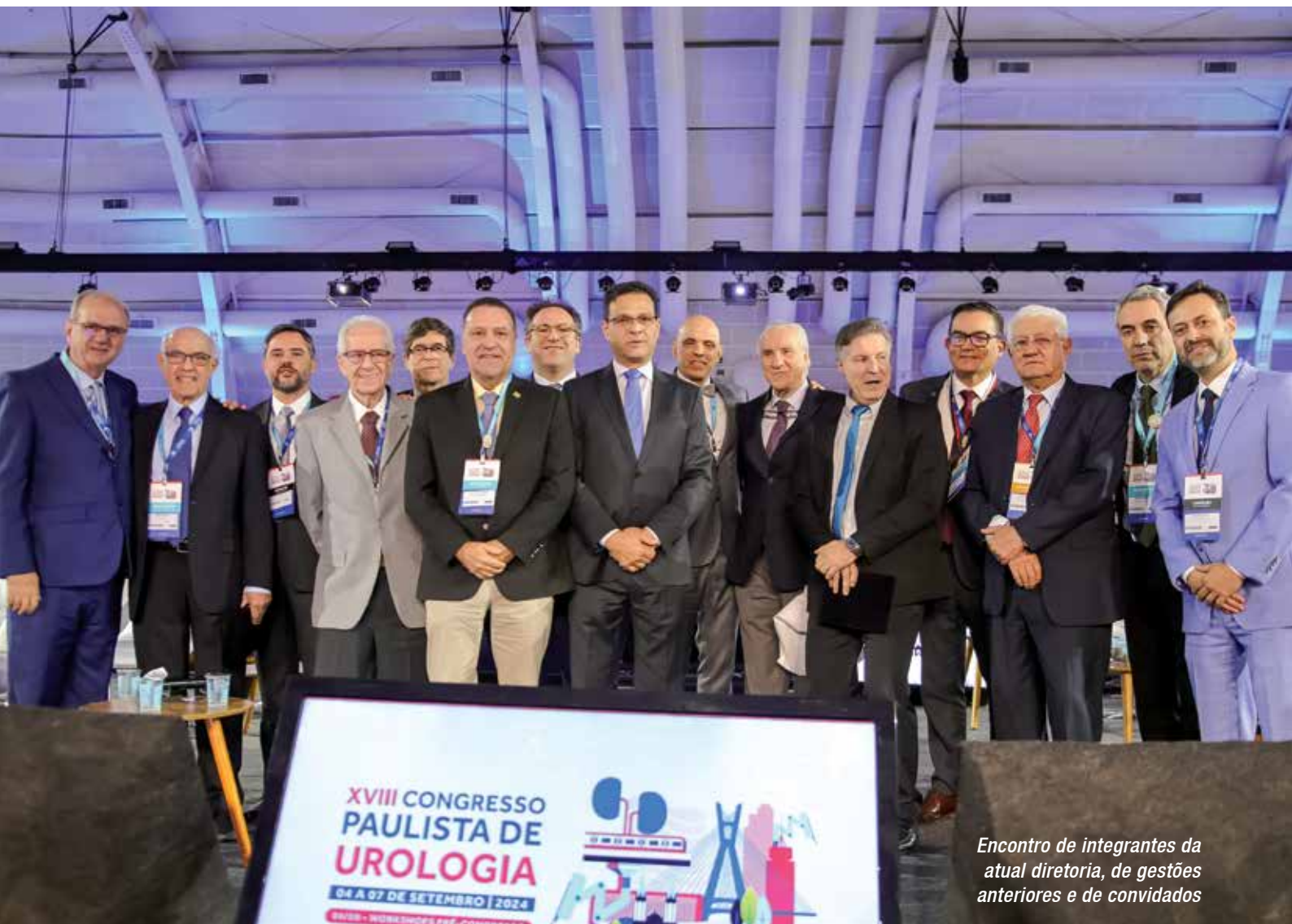
Encontro de integrantes da atual diretoria, de gestões anteriores e de convidados

O WTC Events Center , em São Paulo, recebeu entre os dias 4 e 7 de setembro de 2024 o aguardado XVIII Congresso Paulista de Urologia. Com mais de 3 mil participantes, o evento se destacou como uma grande oportunidade para urologistas e profissionais de saúde se atualizarem com as mais recentes inovações na área e trocarem experiências com colegas de profissão. A programação, ampla e diversificada, aliou inovação e con-